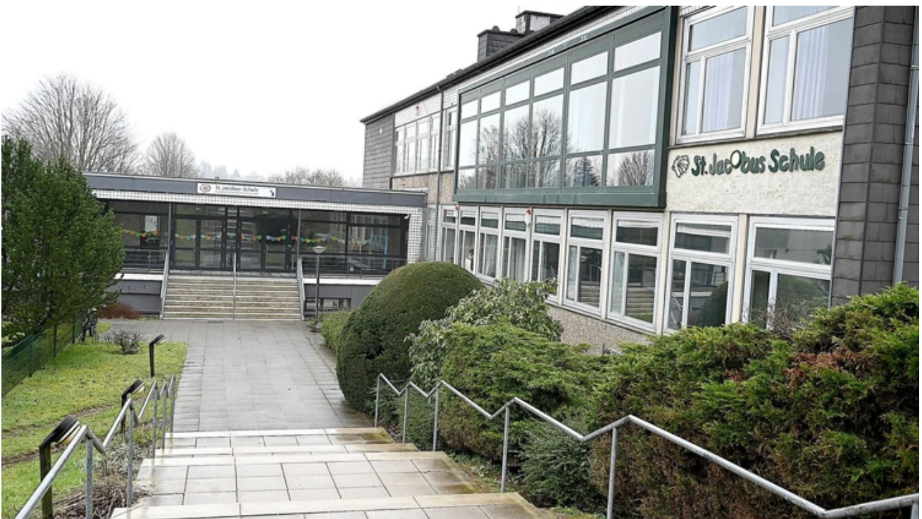
Die Sekundarschule in Breckerfeld.